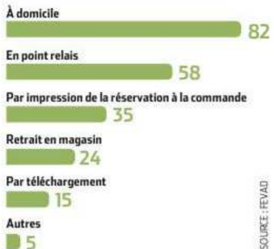
Modes de livraison (% des acheteurs en ligne)